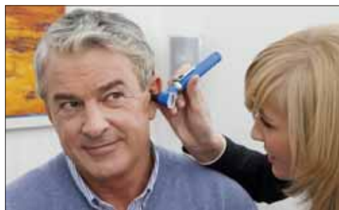
Auch regelmäßige Hörtests sind wichtig. Foto: FGH“

Ein Ohrenarzt oder Hörakustiker kann leicht feststellen, ob eine Hörschwäche vorliegt. Moderne Hörgeräte können dies problemlos ausgleichen. Je früher eine Hörschwäche entdeckt wird, desto besser kann diese kompensiert werden. Wer längere Zeit schlecht hört und nichts dagegen tut, muss das Hören wieder neu lernen.