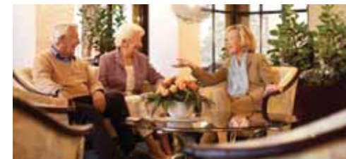
Angenehme Gesellschaft macht den Alltag auch im Alter zum Vergnügen.

Wohnformen für Senioren, die im Bedarfsfall eine Alternative zum klassischen Pflegeheim darstellen, erfreuen sich immer größerer Beliebtheit. Zunehmend mehr Betroffene entscheiden sich für ein Mehrgenerationenhaus, eine Senioren-WG oder für betreutes Wohnen, weil diese vor Vereinsamung schützen und die Selbstständigkeit för-