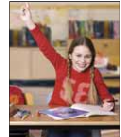
Gut vorbereitet macht die Schule Spaß.

Viel Bewegung, ausreichend Schlaf sowie eine ausgewogene, gesunde Ernährung sind wichtige Faktoren, die zum kindlichen Wohlbefinden beitragen. Dabei kommt dem Frühstück eine besondere Bedeutung zu. Die erste Mahlzeit des Tages sorgt dafür, dass nach der Nacht die Energiespeicher wieder aufgefüllt werden.