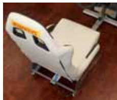
Sich fühlen, wie im Cockpit eines Rennwagens

Dass der verkaufsoffene Sonntag am 6. Juli ein voller Erfolg wird, dafür setzen die Organisatoren um Sonja Kleeschulte auch in diesem Jahr wieder alle Hebel in Bewegung. Sie versprechen einen erlebnisreichen und schönen Tag für die ganze Familie.