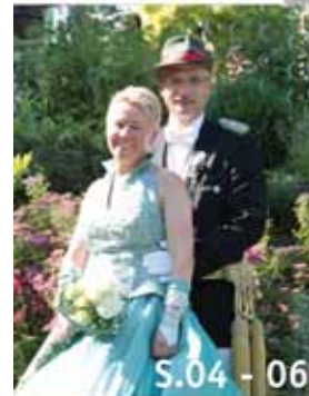
S.04 - 06