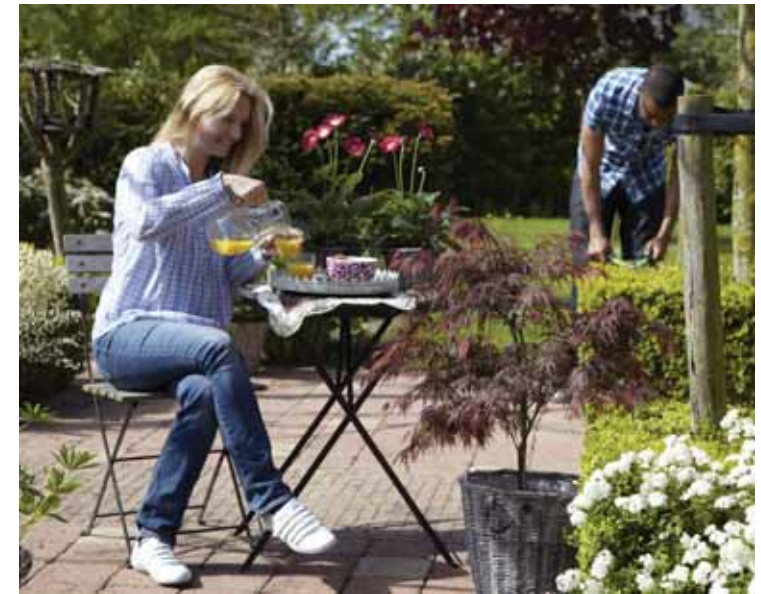
Draußen ist es in der warmen Jahreszeit meist am schönsten. Einige genießen dann ganz entspannt auf der Terrasse die freie Zeit, andere werden lieber im Garten aktiv.

Egal, ob man den Feierabend nach einem langen Arbeitstag oder nach ausgiebiger Gartenpflege genießen möchte - in der warmen Jahreszeit ist es draußen meist am schönsten. Der Lieblingsplatz im Garten kann ganz unterschiedlich sein: Eine Sitzcke am Teich vielleicht, eine Terrasse direkt am Haus, eine nostalgische Holzbank unter einem alten Baum - es gibt viele Möglichkeiten, den Sitzplatz für den Feierabend zu gestalten. Man kann sogar mehrere Lieblingsplätze anlegen, denn die Sonne wandert im Tagesverlauf und so kann ein Sitzplatz, der mor-