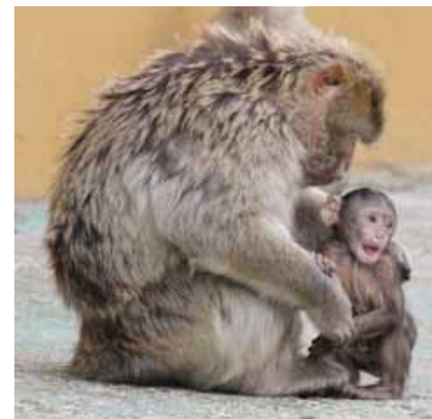
Viel Nachwuchs gibt es im Zoo Safaripark.

Die Herde der Elen-Antilopen ist gewachsen: Fast täglich gibt es neue Kälbchen. Und nicht nur hier: auch die wunderschönen Oryx-Antilopen haben für Nachwuchs gesorgt. „Ableger“ – denn die schwarz-weißen Antilopen legen ihren noch braunen Jungtiere gut getarnt im Schatten ab, um zu grasen. Kälbchen gibt es auch bei den Watussis, den mächtigen Afrika-Rindern.