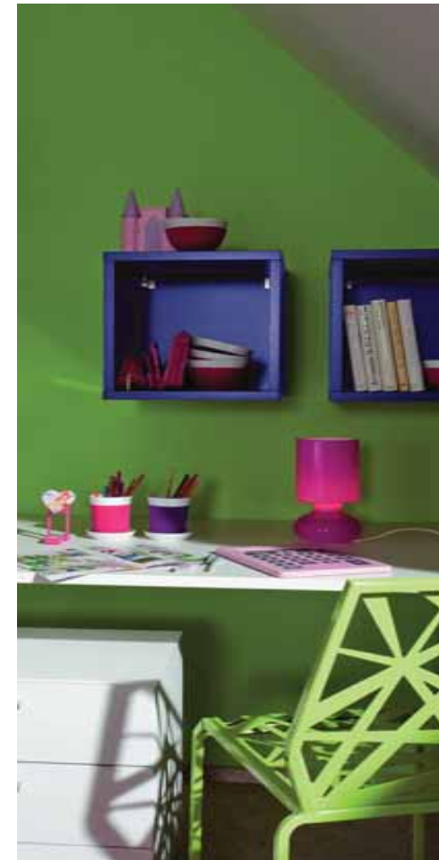
Wenig Aufwand, große Wirkung: Frische Farben verleihen den eigenen vier Wänden im Handumdrehen eine neue Ausstrahlung.

Gerade in Verbindung mit Sonnenstrahlen vermittelt die Farbe viel Wärme und Lebendigkeit. Renovierer können mit den Trendfarben ihren eigenen Ideen freien Lauf lassen und vielfältige Gestaltungsmöglichkeiten nutzen,