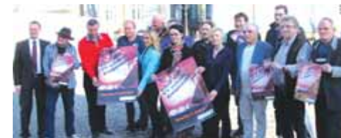
„Lokalrunde“ in Brilon: Zum Kneipenfestival in Brilon ziehen alle Wirte an einem Strang.

reich als Cover-Musiker in und um Brilon unterwegs und fühlt sich in vielen Musikrichtungen zuhause. Egal ob Oldies, Country, deutscher Schlager oder Pop. In seinem Repertoire ist für jeden Musikgeschmack etwas dabei. Das macht ihn bei seinen Auftritten stets zum Stimmungsgarant, wird auch in Brilon bewiesen.