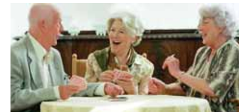
Alternative Wohn- und Lebensformen und ehrenamtlicher Einsatz für Ältere sind angesagt.

Dabei werden ganz unterschiedliche Bereiche gefördert. Die Unterstützung reicht von individuellen Hilfeleistungen für Bedürftige über Fahrten und Veranstaltungen bis hin zu Anschaffungen, die