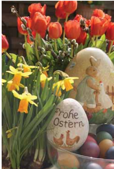
Ostern ist ein traditionelles Frühlings- und Familienfest. In diesem Jahr fallen die Feiertage auf den 20. und 21. April.

Das Ei ist zum Sinnbild für Ostern geworden. Es symbolisiert wie auch der Hase Fruchtbarkeit, steht im Christentum aber auch für die Auf-