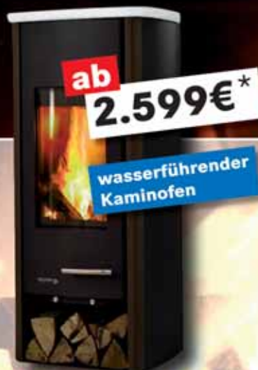
■ TREVISO W