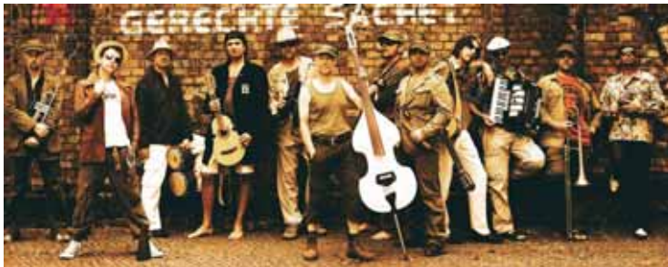
„Los Dos Y Compagneros“, die bayrisch-kubanische Kultband sorgt am Freitag, 12. Juli, für Schwung auf dem Briloner Marktplatz.

„Los Dos Y Compagneros“, die bayrisch-kubanische Kultband sorgt am Freitag, 12. Juli, für Schwung. Seit über 15 Jahren touren die „Salsa-Revolutionäre“ Land auf und ab. Das hat die Mundart-Exoten mittlerweile nicht nur bis ins kubanische Radio gebracht, sondern auch auf viele der wichtigsten Festivals und in TV Kult-Sendungen