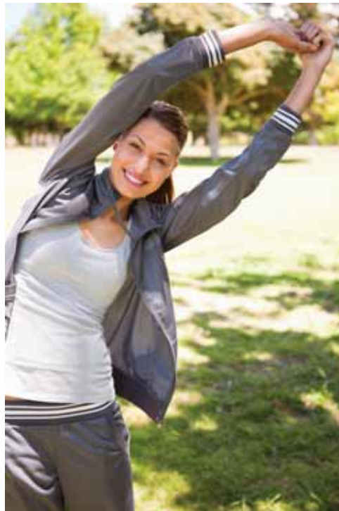
Bei Rückenbeschwerden ist ein Stretching-Programm zur Dehnung der Muskelpartien, die bei Fehlhaltung zur Verkürzung neigen, wichtig.

Wenn schon sitzen, dann richtig: Ein guter Bürostuhl ist höhenverstellbar und hat eine flexible Lehne, die sich Bewegungen anpasst. Arme und Beine bilden etwa einen 90-Grad-Winkel. Dazu müssen die Höhe von Tisch und Stuhl aufeinander abgestimmt sein. Bei längerem Sitzen sollte man auf häufige Haltungswechsel achten: Das Gewicht abwechselnd auf die Gesäßhälften verlagern, das Becken vor- und zurückkippen - oder gleich auf einem beweglichen Hocker oder Ball sitzen. Auch Kippeln, Räkeln und Strecken gehören zum bewegten Sitzen. So wird die Rückenmus-