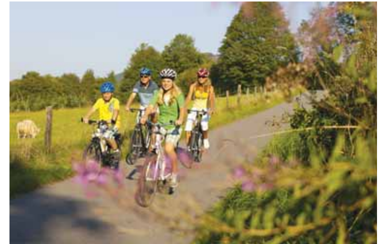
Die heimische Region lädt zu Radtouren, wie hier auf dem SauerlandRadring, förmlich ein.

Die Menschen in Sauerland und Soester Börde können sich glücklich schätzen. Sie wohnen da, wo andere Urlaub machen. Die touristische Beliebtheit dieser Region hat natürlich ihre Gründe: Zum einen die abwechslungsreiche Landschaft mit viel Wasser, weitem Land, Hügeln und Bergen, zum anderen das reichhaltige Angebot an Freizeitaktivitäten. Auch wer in den Sommerferien nicht in den Urlaub fährt, muss hier garantiert keine Langeweile schieben.