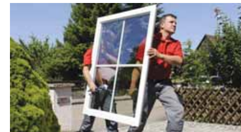
Beim schmutzfreien Fenstertausch werden die neuen Modelle maßgefertigt nach Hause geliefert und montiert.

Damit es erst gar nicht soweit kommt, sollten alle Hausbe- sitzer ihr Dach sorgfältig kon- trollieren lassen. Rund eine Stunde brauchen erfahrene Fachleute dafür. Aber nicht nur Ziegel müssen kontrolliert werden, sondern auch Fallrohre und Regenrinnen, Ortgangbretter, Dachflächen- fenster, Gauben, Zinkeinde- ckungen an Kehlen und Gra- ten, Schornsteine samt den Trittstufen für den Schorn- steinfeger wie auch Schnee- fanggitter, Vordächer und die Paneele der Solaranlage.