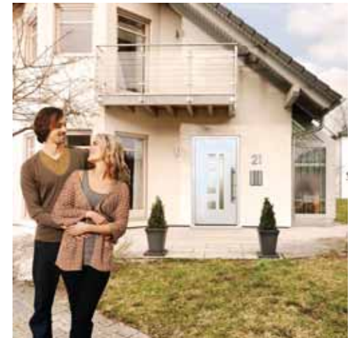
Fassade und Haustür geben ein harmonisches Erscheinungsbild ab.

Neue Haustüren mit Alumi- niumprofil sowie robusten, schlagfesten und lichtechten Oberflächen ersparen es den Bewohnern, alle paar Jahre einen neuen Anstrich der Ein- gangspforte vorzunehmen. So sieht das Entree auch nach langer Zeit noch einladend aus. Mit wärmedämmend gestalteten Türprofilen, Wär- meisolierverglasung, außen