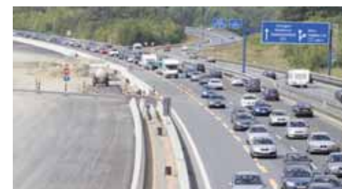
Baustellen an der Autobahn sorgen für erhöhte Staugefahr. Erst recht während der Reisezeit.

densersatzrecht ist innerhalb der EU unterschiedlich geregelt. Daher ist es ratsam, bei einem Unfall einen Rechtsanwalt einzuschalten, der das Sprachproblem entschärft und den Papierkram erledigt. Außerdem sollte nach einem Unfall ein Sachverständiger hinzugezogen werden. Der Fachmann erkennt auch die Schäden am Wagen, die für den Laien verborgen bleiben. kann die Schadenssumme beziffern und mit Rat und Tat zur Seite stehen. Auch eine zusätzliche Auslandsschadenschutzversicherung kann viel Nerven und Ärger ersparen.