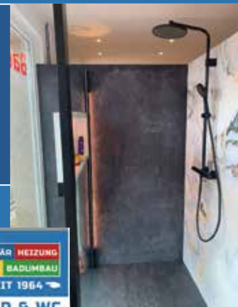
Text und Fotos: SchnellzurDusche