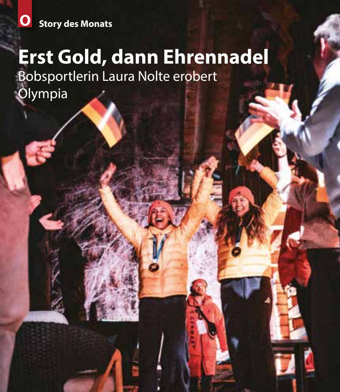
Laura Nolte (rechts) und Deborah Levi feiern ihren Erfolg.

Die Kreisstadt Unna ehrt eine ihrer bekanntesten Persönlichkeiten: Die Bob-Pilotin Laura Nolte, doppelte Olympiasiegerin im Zweierbob, erhielt die Ehrennadel der Stadt Unna. In einer öffentlichen Feierstunde am 12. März wurde die 27-jährige Athletin in der Bürgerhalle des Rathauses ausgezeichnet.