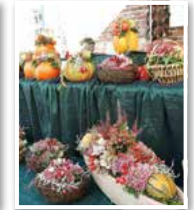
Fröndenberg Seite 8 Frühlingsmarkt