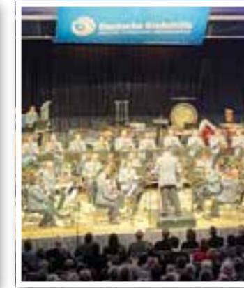
Unna Seite 7 Benefizkonzert