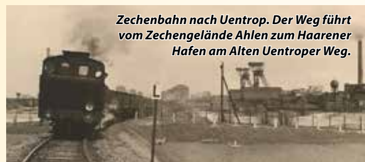
Zechenbahn nach Uentrop. Der Weg führt vom Zechengelände Ahlen zum Haarener Hafen am Alten Uentroper Weg.

Der Jupp-Foto-Club feiert zehn Jahre und modernisiert seine Ausstellungen