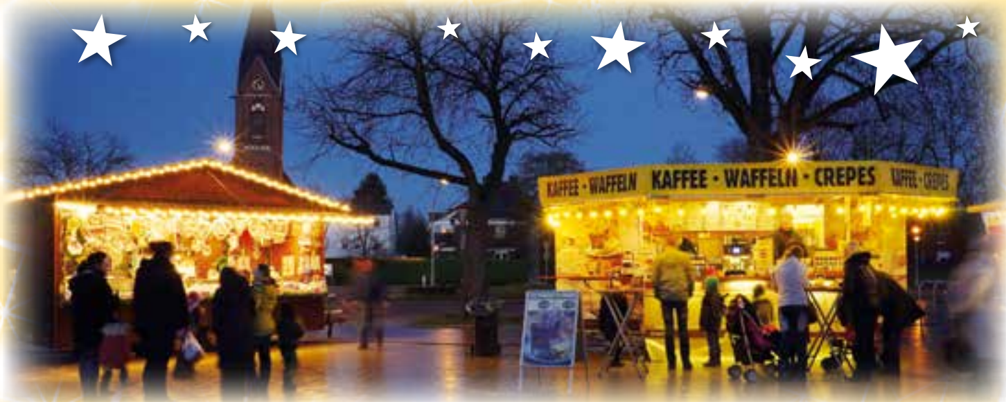
Der Neubeckumer Weihnachtsmarkt öffnet vom 12. bis 14. Dezember seine Pforten.

>>> Neubeckum Nur eine Woche später, vom 12. bis 14. Dezember, lädt der Neubeckumer Weihnachtsmarkt auf dem Rathausvorplatz zu einem stimmungsvollen Adventswochenende ein. Das kleine Hüttendorf bietet alles, was die Vorfreude auf Weihnachten weckt: festliche Klänge, funkelnde Lich-