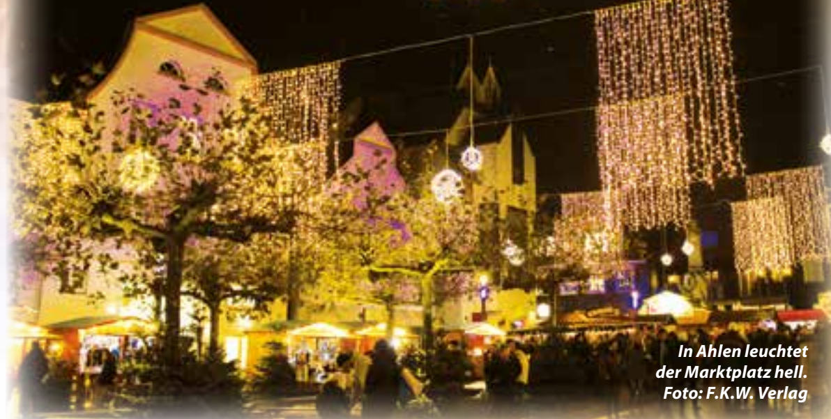
In Ahlen leuchtet der Marktplatz hell.

Der Duft von gebrannten Mandeln, der Klang von Weihnachtsliedern, festliche Stimmung und strahlende Kinderaugen: Die Ahlener dürfen sich in diesem Jahr wieder auf ihren Ahlener Advent freuen. Vom 3. bis zum 14. Dezember lockt die beliebte Veranstaltung in die Innenstadt und hüllt den Marktplatz in adventliches Flair. Außerdem wird es zum zweiten Mal den erleb- baren Adventskalender vom 1. Advent bis Heiligabend geben.