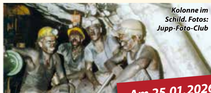
Kolonne im Schild.

der lange offizielle Name schwer einprägsam sei. Danzer schlug daraufhin vor, den Verein nach Jupp Hesse zu benennen – ein Vorschlag, der sich durchsetzte. Im Mittelpunkt der Sammlung stehen das Steinkohlebergwerk und die Kokerei Westfalen sowie die Bergarbeiterkolonien in den südlichen und östlichen Stadtteilen Ahlens. Ergänzt wird die Dokumentation durch Aufnahmen des Strontianitbergbaus, historischer Gebäude und längst geschlossener Fabriken. Die Fotos zeigen Bergleute bei der Arbeit unter Tage, oft mit Kohlenstaub im Gesicht, Kinder und Gruppen vor den Zechenhäusern sowie zahlreiche historische Gebäude. Auf rund 150 Quadratmetern bieten die Vereinsräume am Glückaufplatz 11 wechselnde Ausstellungen.