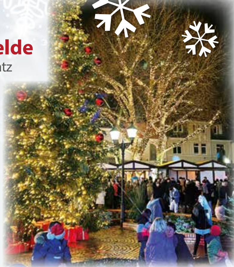
Der Carl-Haver-Platz mit leuchtenden Bäumen.

warme Getränke und herzhafte Speisen sorgen. An diesem Tag ist das Winterleuchten von 17 bis 22 Uhr geöffnet. Am Freitag, 5. Dezember, steht Musik im Vordergrund: Die Musikschule Kreatief eröffnet um 16.30 Uhr das Abendprogramm auf der Bühne vor der St. Johannes-Kirche. Danach treten Jannik Regenbergs um 19 Uhr, die Band Lakeside Inn und Funky Fribe auf, die mit energiegeladenen Songs und groovigen Rhythmen für ein abwechslungsreiches musikalisches Programm sorgen. Auch am Freitag sind Stände und Bühnenprogramm von 17 bis 22 Uhr geöffnet. Am Samstag, 6. Dezember, verwandelt die Band ENORM den Carl-Haver-Platz in eine lebendige Konzertbühne. Mit mit-