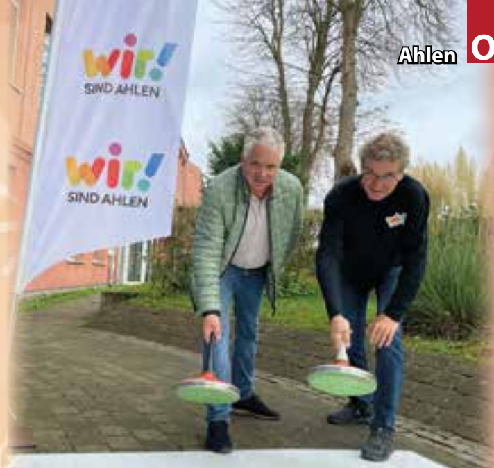
Die Eisstockbahn ist in Ahlen Tradition.