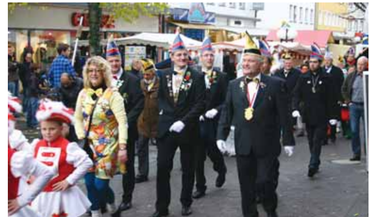
Der Umzug des Mescheder Kolping Karnevals am NovemberSonntag ist ein absoluter Höhepunkt, der schon 2012 für Jubel sorgte.

Natürlich wird auch wieder an den Nachwuchs gedacht. Das Kinderschminken ist ja nun fast schon feste Tradition und wird von den kleinen Gästen bestens angenommen. Doch bevor sich die Türen öffnen, startet der Tag um 12.30 Uhr mit dem ersten Höhepunkt. Dann findet die Preisverleihung des „Star des