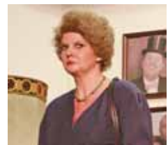
Ein grimmiger Blick – die Wallener Akteure sind mit Haut und Haaren in ihr Bühnenspiel vertieft

Also schon mal die Termine vormerken: Samstag, 23. November, 20 Uhr, und Sonntag, 24. November, 16 Uhr. Karten gibt es nur an der Abendkasse. Und sollte es voller als erwartet werden, findet der einzelne Zuschauer auch schon mal auf einer Bierkiste Platz.