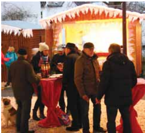
Vom 6. bis 8. Dezember findet in Meschede wieder der Weihnachtsmarkt statt.