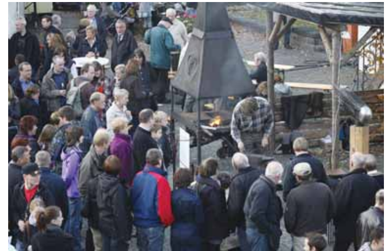
Die Gelegenheit, einen Hufschmied bei der Arbeit zu beobachten, hat der moderne Mensch auch nicht jeden Tag. Aber im vorigen Jahr beim Martinsmarkt.

Die Villa KünstlerBunt präsentiert in ihren neuen Räumen ihre große Jahresausstellung mit Objekten aus den Bereichen Malerei, Holz, Keramik, Stein und Fotografie. Kaffee und Kuchen werden in diesem Jahr im Alten Saal in Markes Haus angeboten. Hier braucht es aber weiterhin tatkräftige Unterstützung. Für Kuchenspenden