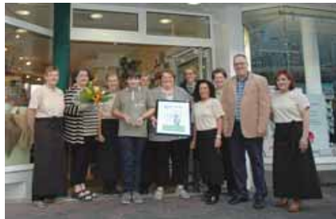
Inhaber und Angestellte des Café Frings konnten sich 2012 über den „Star des Handels“ freuen.

Meschede. (pb) Auch im Jahr 2013 sucht das Stadtmarketing Meschede wieder den „Star des Handels“. Bis zum 4. November können die Kunden über die freundlichsten, verlässlichsten und kompetentesten Händler, Dienstleister und Gastronomen abstimmen.