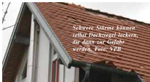
Schwere Stürme können selbst Dachziegel lockern, die dann zur Gefahr werden.

Kommt zum Sturm schwerer Regen, dann können auch Dächer, in die es seit Jahren oder sogar noch nie hinein geregnet hat, durchnässt werden. Diese Wasserschäden dürfen keinesfalls auf die leichte Schulter genommen