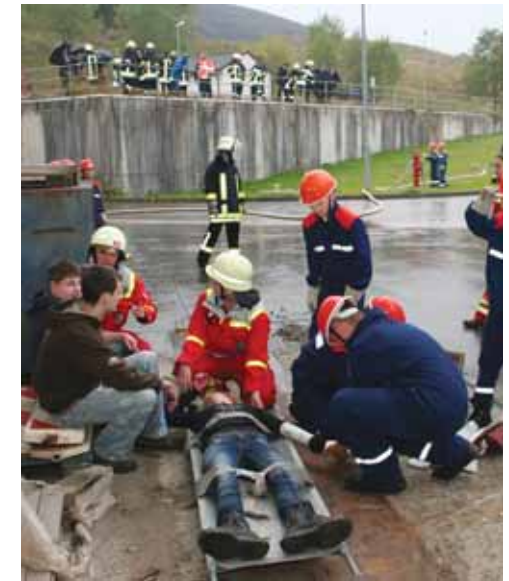
Die Mitglieder der Jugendfeuerwehr übernahmen die Erstversorgung der Verletzten.