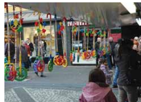
Mag der November auch grau und trüb sein. Der verkaufsoffene Sonntag sorgt auf jeden Fall für Farbe - und die Kinder freut's.

durch die Ruhrstraße brachte damals den ersten Eindruck von der herannahenden fünften Jahreszeit. Und auch diesmal werden die Narren mit Prinz, Prinzessin und Tanzgarde wieder unter dem Jubel und dem Beifall des Publikums zur Bühne auf dem „Kaiser-Otto-Platz“ ziehen. Hier gibt es mit einigen Programmpunkten und dem Gardetanz das erste Hineinschnuppern in die kommenden närrischen Monate voller jecker Höhepunkte.