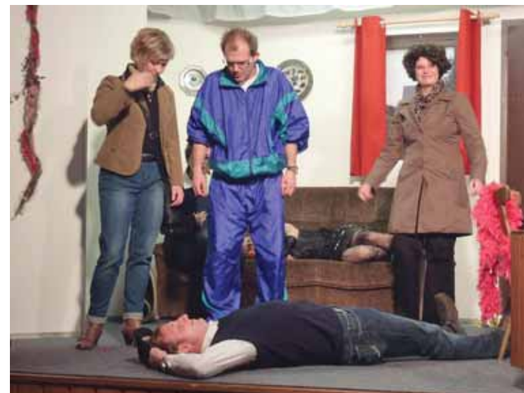
Da haut es ihn nieder: die Laienspielgruppe mit vollem Körpereinsatz.