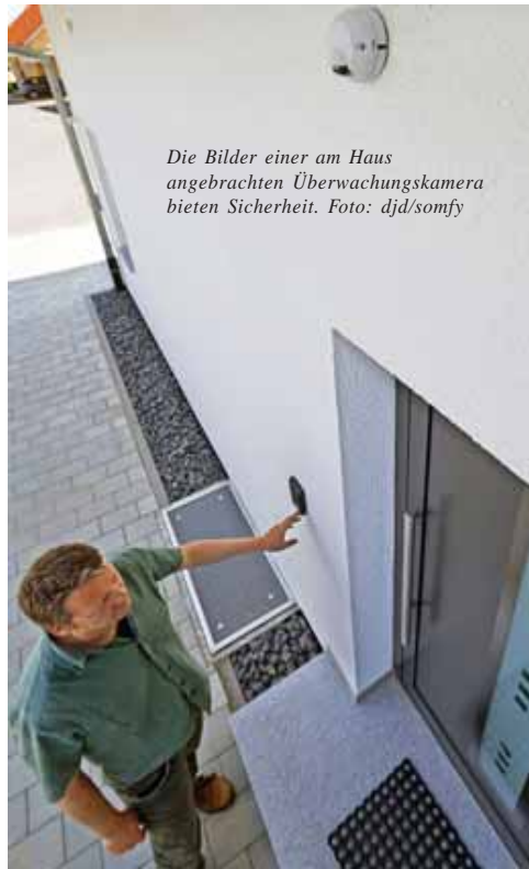
Die Bilder einer am Haus angebrachten Überwachungskamera bieten Sicherheit.

Doch muss es nicht ein Einbrecher sein, der zur Gefahr wird: Im häuslichen Umfeld lauern Treppenstufen und Höhenunterschiede, die im täglichen Leben zum Problem werden können. „Nicht am falschen Ende sparen“, heißt der Expertenrat: Wer Treppen und kritische Bereiche gut beleuch-