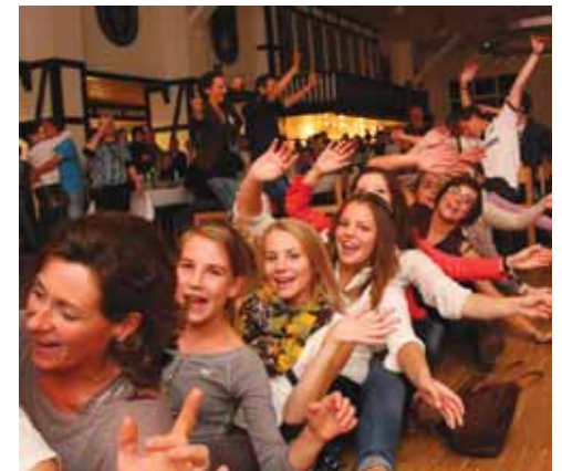
Ausgelassene Stimmung herrschte bei der großen Jubiläumsfeier.

Weitere Infos auf der TuRa Homepage www.tura-freienohl.de und in der Chronik zur 125-Jahr-Feier.