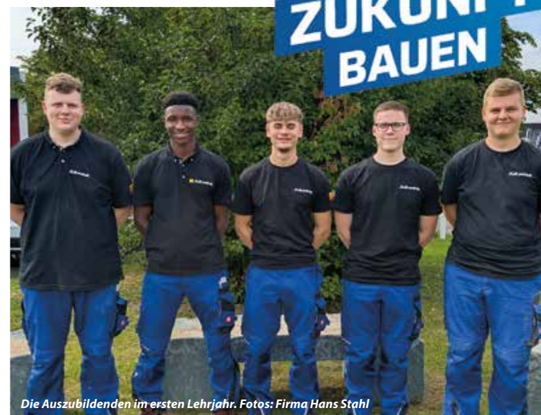
Die Auszubildenden im ersten Lehrjahr.