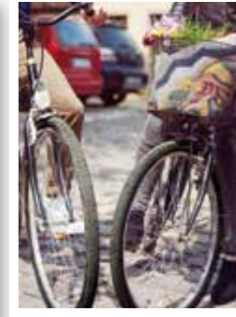
Warstein Seite 6 Spargelsonntag