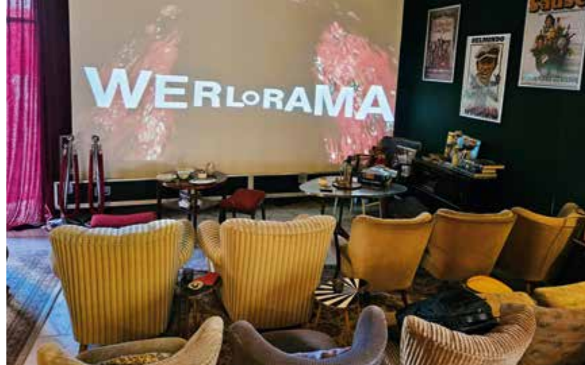
Die Leinwand ist mobil und beweglich, die Sitze im Retro-Stil.

Von der Grundidee her sollte das Werlorama etwas Familiäres verkörpern. Während der Vorstellung soll niemand in die Jacke schlüpfen und vorzeitig gehen. „Im besten Fall sollen die Zuschauer nach der Vorstellung sitzen bleiben, über den Film sprechen und etwas trinken. Manchmal mache ich auch ein Quiz mit Fragen zum Film