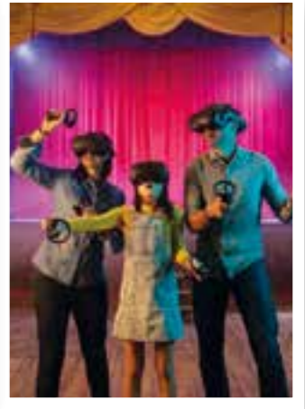
Verlosung Seite 27 FORT FUN