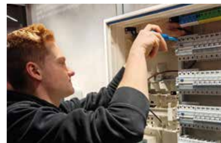
Ein Auszubildender der Firma Stahl auf der Elektromesse in Dortmund.

Volmer macht deutlich, dass die Firma Stahl junge Menschen ausbildet, damit sie hinterher