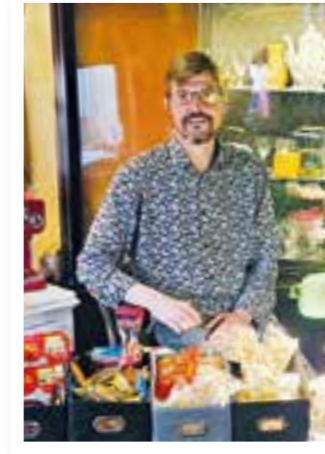
Exklusiv Seite 4 Werlorama