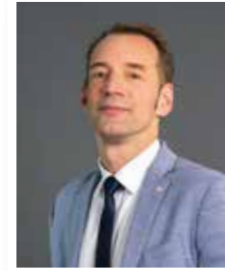
Exklusiv Seite 4 Bürgermeister Marcus Schiffer