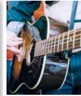
Soest Seite 6 Kneipenfestival