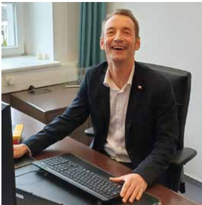
Im Arbeitsalltag angekommen: Bürgermeister Markus Schiffer spricht von „Flow“ – und meint damit konzentrierte Energie für Soest.

Marcus Schiffer über seine ersten 100 Tage im Amt