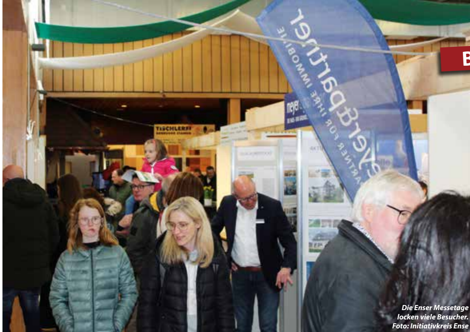
Die Enser Messetage locken viele Besucher.