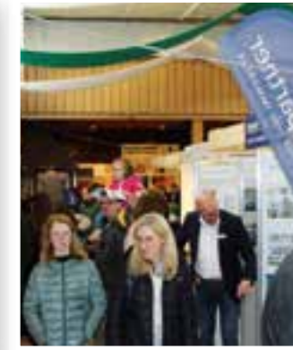
Ense Seite 8 Enser MeTa