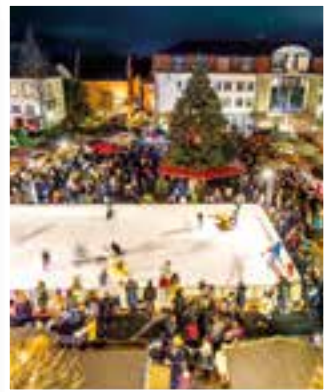
Werl Seite 9 Winterzauber