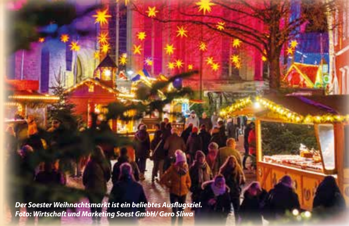
Der Soester Weihnachtsmarkt ist ein beliebtes Ausflugsziel.

von Glühwein durch die Gassen zieht, beginnt die schönste Zeit des Jahres: Der Soester Weihnachtsmarkt öffnet seine Pforten und verwandelt die Altstadt mit ihren Grünsandstein-Kirchen und historischen Plätzen in ein stimmungsvolles Wintermärchen. Besucher dürfen sich vom 24. November bis 22. Dezember auf rund hundert