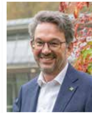
Exklusiv Seite 4 Bürgermeister Ruthemeyer