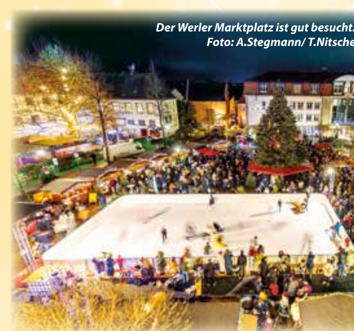
Der Werler Marktplatz ist gut besucht.

für Livemusik vom Feinsten. Wie ein Lieblingsradiosender bringen sie die größten Hits aller Zeiten live auf die Bühne. Im Anschluss übernimmt DJ Bolle das musikalische Ruder: Mit mehr als 14 Jahren Erfahrung und über 600 Events garantiert er den perfekten Party-Vibe. Ob Tanzklassiker oder aktuelle Charts – er lässt die Stimmung in der Stadthalle kochen. Wer sich kurz vor Weihnachten ein Highlight gönnen möchte, sollte diese Mischung aus Livemusik, DJ-Power und festlicher Atmosphäre auf keinen Fall verpassen.