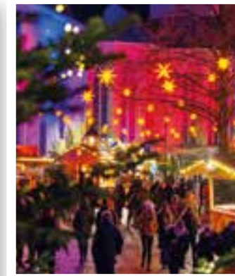
Soest Seite 6 Soester Weihnachtsmarkt