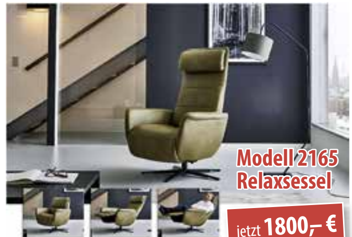
Modell 2165 Relaxsessel