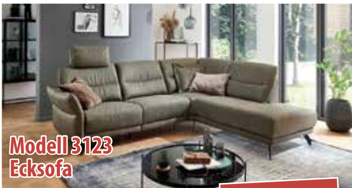
Modell 3123 Ecksofa