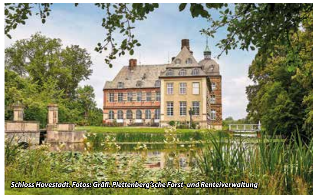
Schloss Hovestadt.

Schloss Hovestadt ist ein Paradebeispiel für die Architektur der Renaissance. Die heute sichtbare Hauptanlage entstand zwischen 1563 und 1572, als Laurenz von Brachum den Rittersitz in ein prachtvolles Wasserschloss verwandelte. Die mächtigen Mauern, die kunstvollen Giebel und die Wassergräben verleihen dem Bauwerk eine fast märchenhafte Ausstrahlung. Im 18. Jahrhundert wurde die Vorburg barock umgestaltet, und die Anlage erhielt die eleganten Akzente, die sie heute prägen. Die Verbindung von Renaissance und Barock macht Schloss Hovestadt einzigartig - es ist nicht nur ein Zeugnis vergangener Epochen, sondern auch ein lebendiges Denkmal, das bis heute bewohnt wird.