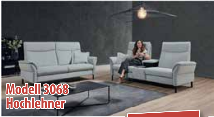
Modell 3068 Hochlehner