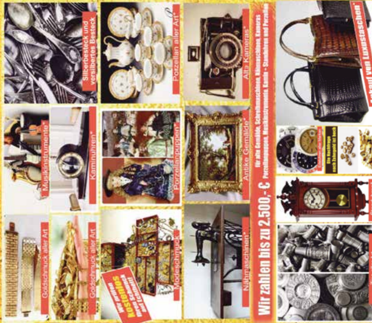
Goldschmuck aller Art

Alte und Lederjackets, Lederhosen und Lederwaren aus Leder- und Wildleder, auch Sammelbestände zum Höchstpreis bis zu 2.000 €