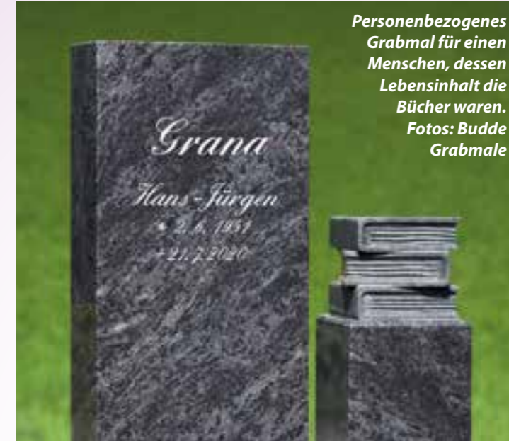
Personenbezogenes Grabmal für einen Menschen, dessen Lebensinhalt die Bücher waren.

Ein Grabstein markiert nicht nur eine Ruhestätte. Er erzählt von einem Menschen, der gelebt hat: von Anna, die Mutter von vier Kindern war. Von Josef, der 50 Jahre lang als Steinmetz gearbeitet hat. Von Maria, deren Grabstein von einer Rose geziert wird – vielleicht ein Symbol für ihre Liebe zur Natur oder ihren Vornamen. In einer Zeit, in der vieles digital, schnell und anonym geworden ist, bewahren Grabmale das Persönliche, Handfeste. Sie tragen Namen, Daten, Symbole oder liebevolle Worte wie „Unvergessen“, „In Liebe“ oder „Für immer in unserem Herzen“. Diese Worte sind nicht nur Inschrift – sie sind gelebte Verbundenheit.