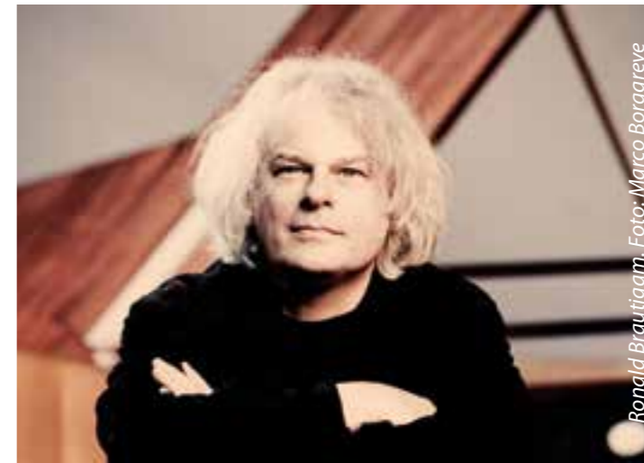
Ronald Brautigam