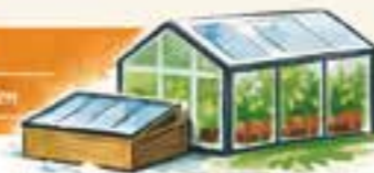
Grafik: F.K.W. Verlag