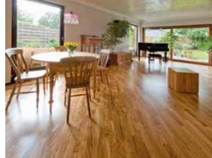
Bevor das hochwertige Olivenholz verlegt und auf ihm gespielt und getanzt wurde, hat es bereits mehrere hundert Jahre bewegter Geschichte in den toskanischen Olivenhainen erleben dürfen.

Ist die Dämmung angebracht und die Wand fertig eingezogen, dann sorgen Sie doch gleich mit ökologischen Wandfarben die für Aufbruchstimmung im Zuhause. Im Trend liegen vor allem Naturtöne und Farben, die Wärme und Geborgenheit vermitteln. So schafft zum Beispiel das sanfte Creme von Breezy eine buchstäblich frische Brise, während Seaside an einen Spaziergang am Meer erinnert. Für Wüstenwärme an den Wänden ist das Terrakotta-Braun von Arizona verantwortlich, während Crema, angelehnt an die Farbe einer guten Espresso-Creme, für entspannte Momente sorgt. Der sanfte Grün-Ton Olive bringt eine Atmosphäre der Ruhe, während Universe ins All entführt. Die Wandfarben sind einfach zu verarbeiten, haben eine hohe Deckkraft und sind frei von Lösemitteln, Weichmachern oder Konservierungsmitteln – damit sind sie auch für Allergiker geeignet.