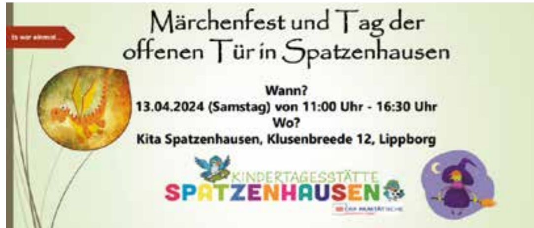
Flyer: Kita Spatzenhausen

Die Teilnehmenden können sich auf ein buntes Programm für Kinder mit Kreativangeboten, diversen Spielen, einer Tombola sowie dem Ballonkünstler Marc Beyer, der von 14 bis 16 Uhr auftritt, freuen. „Das Programm wird von den