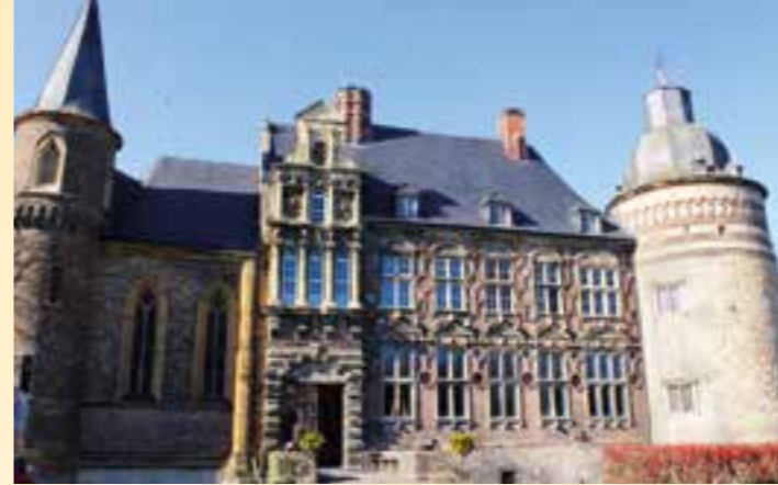
Haus Assen.

in eine Wabenstruktur eingeteilt. An den Eckpunkten jeder Wabe sind so Knotenpunkte entstanden, an denen die Weiterfahrt in mehrere Richtungen möglich ist. Sie sind mit einer Zahl durchnummeriert und geben eine gute Orientierung – so kommt