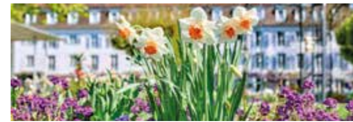
Die Schlösser und Parks am Bodensee öffnen im Frühling ihre Tore und laden zum Entdecken ein.

direkt am Flutsaum über Natur-entdeckungen etwa auf dem Ellenbogen bis hin zu den Dünen, die selbst permanent weiterwandern. Sehenswert sind die facettenreiche Landschaft und die große Artenvielfalt auf dem Lister Ellenbogen – hier können Urlauber zugleich den nördlichsten Punkt Deutschlands bestaunen. Ein besonderes Erlebnis ist eine geführte Tour zu den Wanderdünen: Sie sind