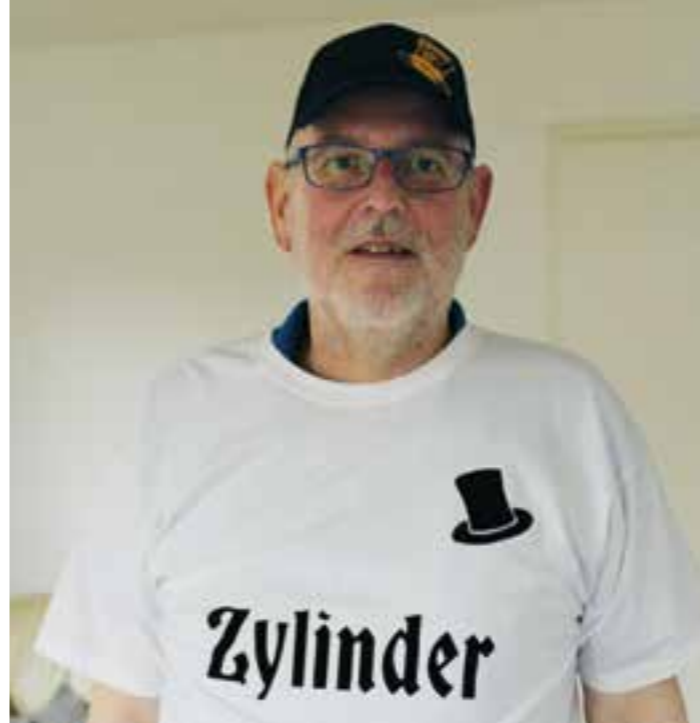
Ludger Overhage

Damit das aufgefangene Regenwasser optimal genutzt wird, ist es ratsam, am besten frühmorgens oder spätabends zu gießen. Außerdem gilt: lieber intensiver und dafür nicht so häufig wässern. So kann die Feuchtigkeit die tieferen Wurzelbereiche besser erreichen. Noch wichtiger aber ist das Mulchen. Die Abdeckung freier Bodenflächen mit Rasenschnitt oder Laub hält die Feuchtigkeit länger im Boden und sorgt für zusätzliche Nährstoffe. Außerdem sollte der Rasen nicht zu kurz geschoren werden, weil er dann anfälliger für Trockenheit ist. Wer das Gras wachsen lässt, muss weniger wässern. Tatsächlich kommt eine Wildblumenwiese meist sogar ganz ohne Bewässerung aus. Auch heimische Gehölze und Stauden, wie Feldahorn oder Wiesensalbei, kommen mit Trockenheit weitaus besser zurecht als Exoten wie Hortensie und Rhododendron. (akz-o)