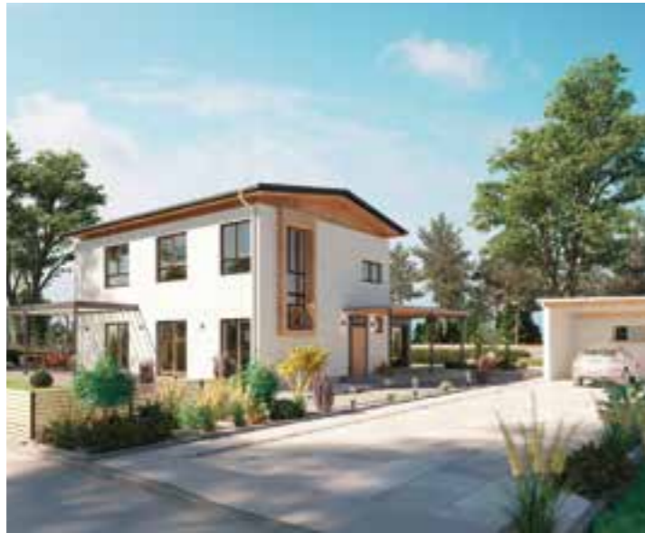
Bei diesem Fertighaus tragen die perfekt gedämmte Gebäudehülle, der Einsatz von regenerativen Energien sowie eine effiziente Wärmerückgewinnung dazu bei, dass das Klima entlastet wird.

Wer von einem eigenen Haus im Grünen nicht nur träumt, sondern es auch realisiert, möchte einen bleibenden Wert schaffen. Doch in die Zukunft zu investieren bedeutet heute auch immer, an die Umwelt zu denken. Mit Produkten aus Holz können Sie dies tun.