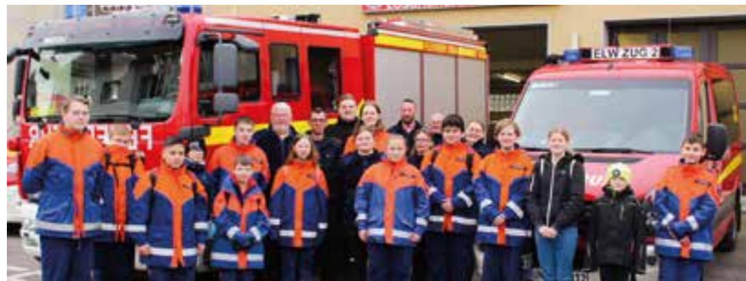
Gestartet wurde die Aufräumaktion der Jugendfeuerwehr am Feuerwehrgerätehaus.

Wieder waren rund 200 engagierte kleine und große „Müllsammelnde“ in den Massener Ortsteilen unterwegs.