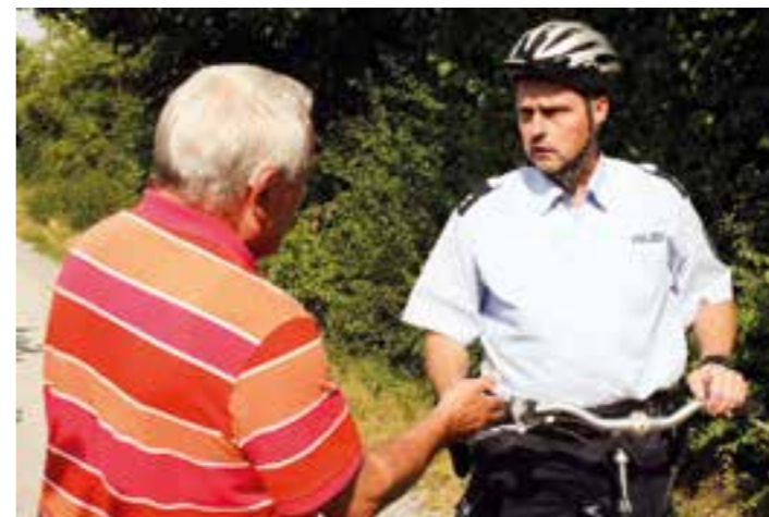
In seinem Element: bürgernah und auf dem Rad, hier im Jahr 2013.

Genau 28,5 Jahre war der sympathische Polizeibeamte Bezirksbeamter in Massen. Über die Jahre ist dem Lünerner der Ort ans Herz gewachsen. Einer der Gründe, warum er mit Herzblut und Engagement seinem Dienstort stets die Treue gehalten hat.