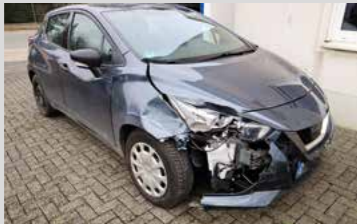
Sachverständige sind Ihre Ansprechpartner im Schadenfall.

Ein Unfall oder eine andere Ursache für einen Schaden am eigenen Auto ist ärgerlich. Noch ärgerlicher wird's, wenn sich herausstellt, dass der gekaufte, augenscheinlich einwandfreie Gebrauchtwagen bereits einen Unfallschaden hatte. Bleibt man dann auf den Kosten sitzen?