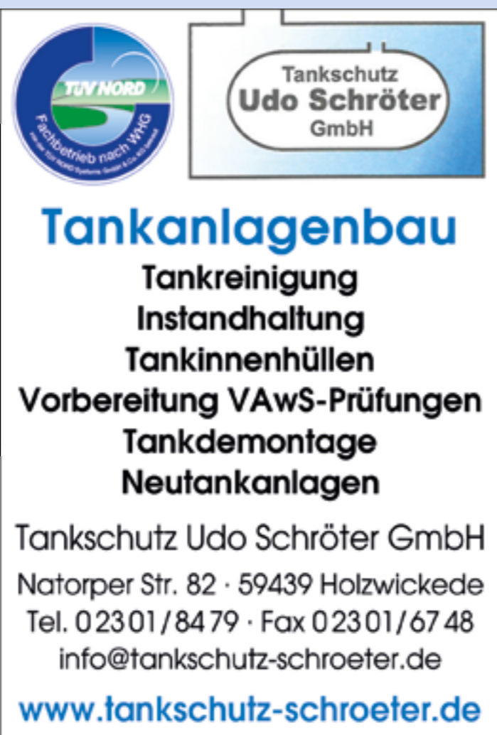
- Anzeige -

Nutzen Sie die langjährige Erfahrung von Tankschutz Schröter und nehmen Sie jetzt Kontakt auf. Wir beraten Sie gerne.