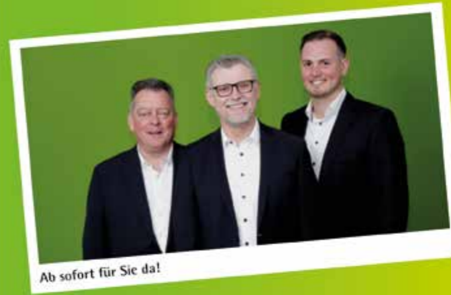
Ab sofort für Sie da!

Wir beraten in allen Versicherungs- und Finanzfragen