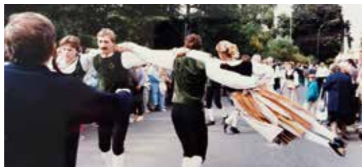
Text + Fotos: Hartmut Hegeler