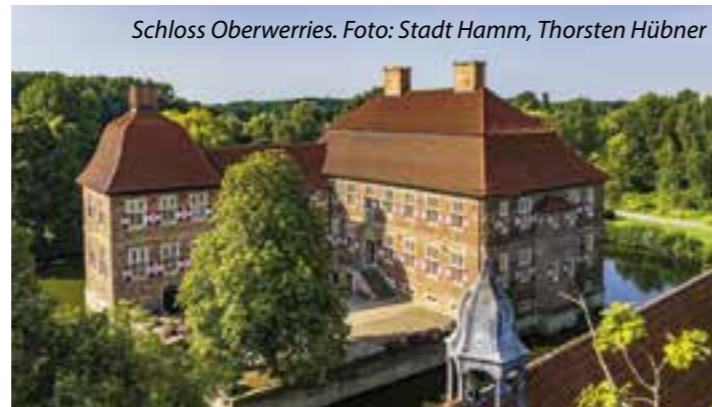
Schloss Oberwerries.

Die etwa zweistündige Stadtrundfahrt führt unter anderem an Streuobstwiesen, Bergarbeitersiedlungen, Schlössern, Gewerbeparks, Zechenarealen sowie Zeitzeugen der Stadtgeschichte vorbei. Hierbei kann das einzigartige Wechselspiel zwischen moderner Metropo-