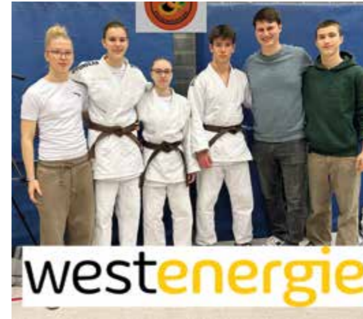
Westdeutsche Einzelmeisterschaften U15

Im Februar nahmen die Judoka des Judo-Clubs Holzwickede in den Altersklassen U15 und U18 an den Westdeutschen Einzelmeisterschaften in Herne und Dormagen teil und zeigten ihr Können.