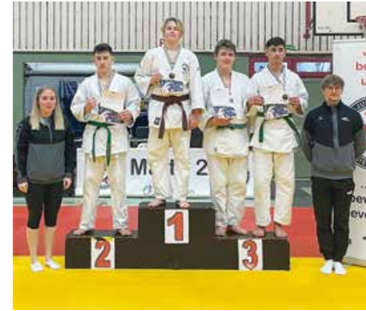
Westdeutsche Einzelmeisterschaften U18

Am Samstag, 28. Februar, und Sonntag, 1. März, traf sich die Judo-Elite der Altersklasse U15 zur Westdeutschen Einzelmeisterschaft in Dormagen. Der Judo-Club Holzwickede war mit mehreren Athletinnen und Athleten vertreten und konnte dabei starke Ergebnisse er-