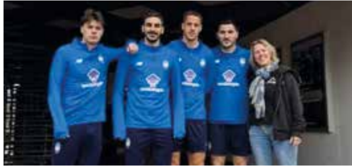
Bei der Trainingseinheit des BVB-Bezwingers in der Champions League, Atalanta Bergamo, in Holzwickede, war ein Teil der Spieler auch auf Organisation und Vermittlung des Holzwickeder SC im Fit'n Well.

Am Sonntag, 1. Februar, erweiterte der Holzwickeder Sport Club die Infrastruktur für den leistungsorientierten Fußball durch eine Kooperation mit dem Fitness- und Gesundheitszentrum Fit'n Well.