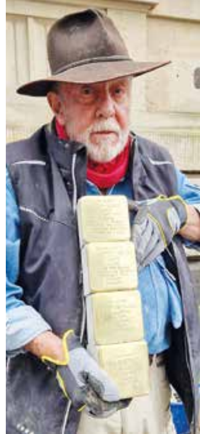
Gunter Demnig

Im Anschluss an die Verlegung lädt die Gemeinde Holzwickede gegen 10 Uhr zu einem gemeinsamen Kaffeetrinken und Gedankenaustausch in das Haus des DRK-Ortsvereins Holzwickede e.V., Schwerter Straße 9, ein. Interessierte Bürgerinnen und Bürger sind herzlich willkommen, um an diesem Tag gemeinsam zu gedenken und ins Gespräch zu kommen. Für die Teilnahme ist eine verbindliche Anmeldung per E-Mail an archiv@holzwickede.de