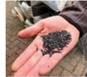
Anthrazitkohle in den Filterkesseln fängt die Schmutzstoffe auf.

de beim Einbau leider schlecht verarbeitet und hat Osmoseschäden erlitten. Die Folge: Luftblasen, Säurebildung, Wellen und durch eigene Reparaturbemühungen auch unschöne Kanten. Nun kümmert sich ein Fachbetrieb, der – anders als beim Einbau – witterungsgeschützt arbeitet, um ein einwandfreies Becken für die nächste Saison.