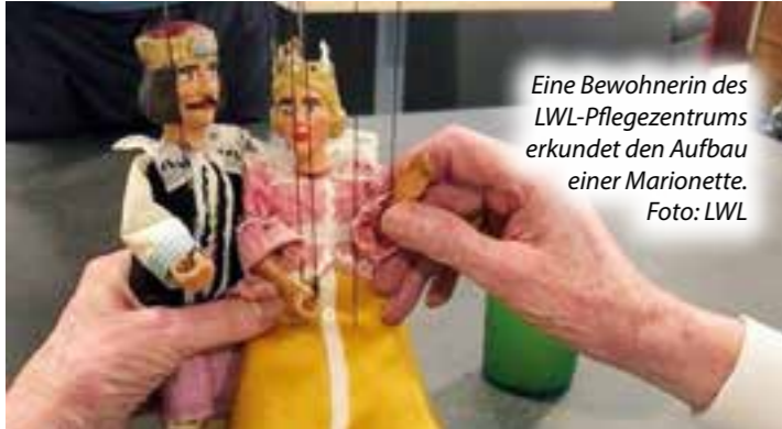
Eine Bewohnerin des LWL-Pflegezentrums erkundet den Aufbau einer Marionette.

Das „Theater aus der Truhe“ hat das LWL-Pflegezentrum „Am Apfelbach“ in Dortmund-Aplerbeck besucht.