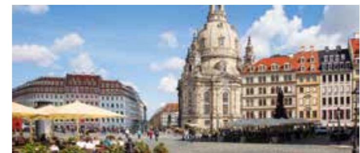
Ein Stadtrundgang durch die sächsische Landeshauptstadt Dresden steht auch auf dem Programm.

Der Holzwickedede-Colditz-Verein e. V. sucht noch MitfahrerInnen für seine geplante Sommertour am langen Fronleichnam-Wochenende in die Partnerstadt Colditz/Sachsen, Landkreis Leipzig. Auf dem Programm stehen neben der Partnerstadt auch eine Bootsfahrt sowie Ausflüge zur „Stadt aus Eisen“ Ferropolis und nach Dresden.